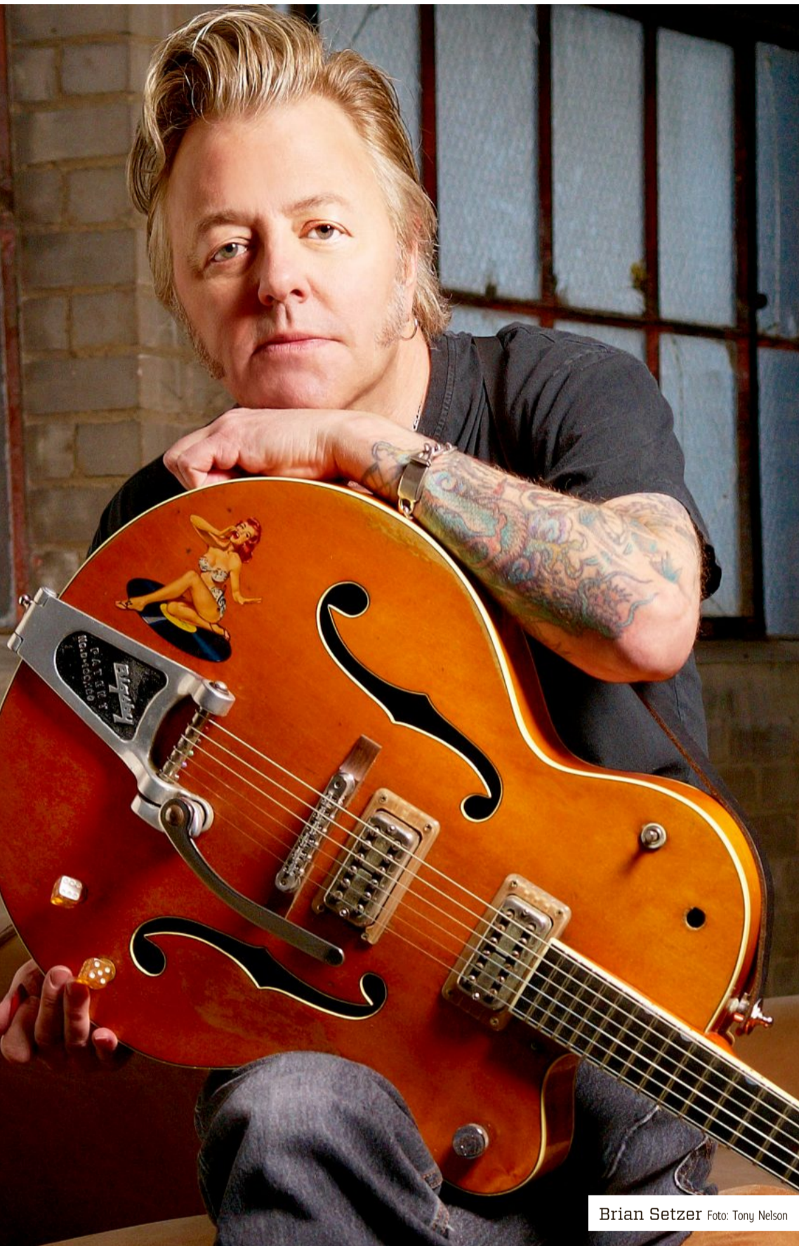
Brian Setzer